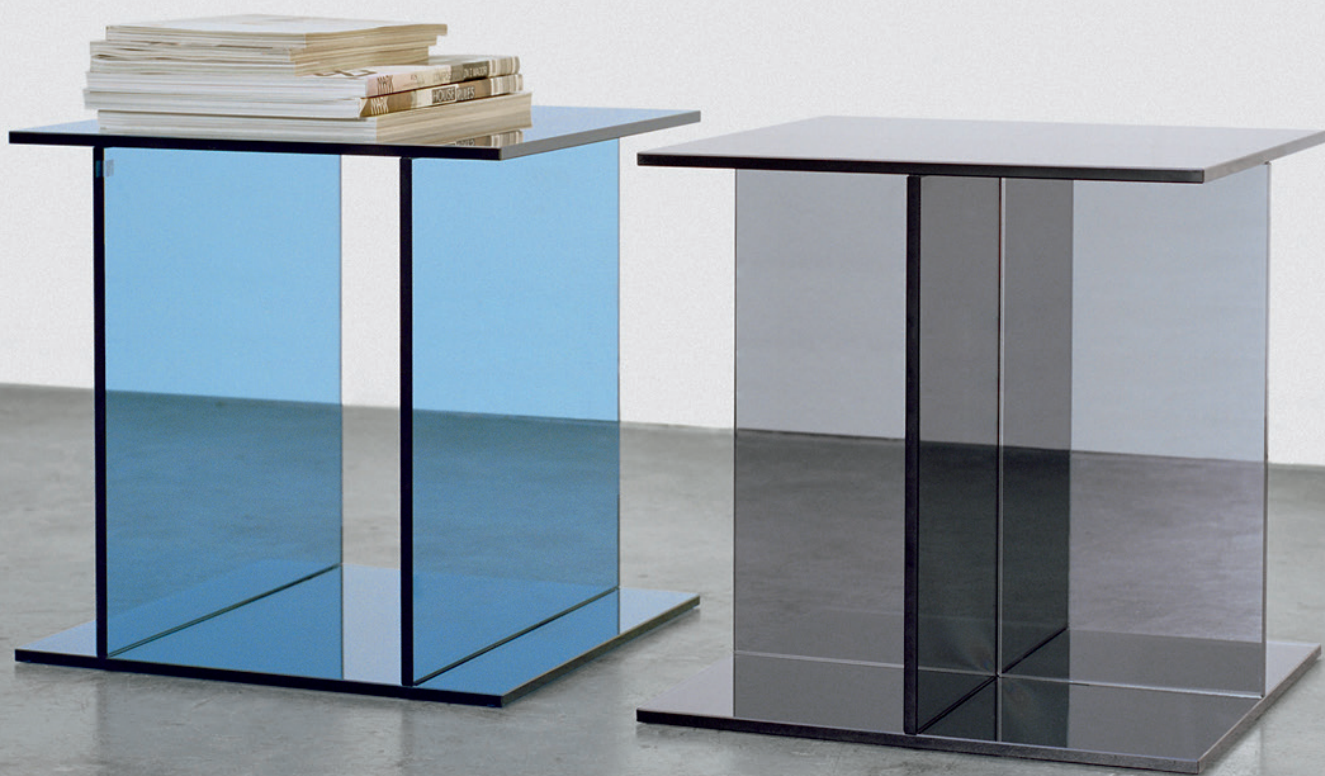
CT08 VIER BEISTELLTISCH / SIDE TABLE GLAS, RAUCHGRAU / GLASS, SMOKE GREY CT07 DREI BEISTELLTISCH / SIDE TABLE