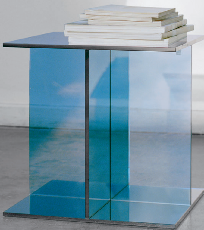
CT08 VIER BEISTELLTISCH / SIDE TABLE GLAS, DUNKELBLAU / GLASS, DARK BLUE CH04 HOUDINI STUHL / SIDE CHAIR